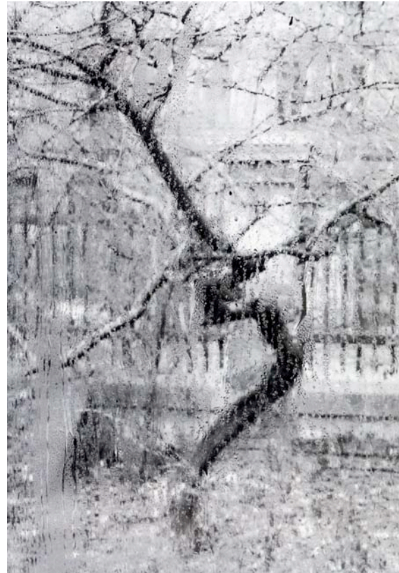
Josef Sudek: „Fenster meines Ateliers“, 1944 (aus: Josef Sudek. Das stille Leben der Dinge. Fotografien von 1940–1970 aus der Moravská Galerie, Brno , Ausstellungskatalog Kunstmuseum Wolfsburg, Wolfsburg 1998, S. 30)

Doch ergibt sich ein solcher Befund nicht genauso oder wird vielleicht noch deutlicher, wenn dem Bild eine Aufnahme des tschechischen Fotografen Josef Sudek aus dem Jahr 1944 gegenübergestellt wird? Als wären es Vexierbilder, wendet man in einem Fall die negative Ansicht ins Positive, während im anderen Fall der Blick die regennassen Partien auf dem Glas des Atelierfensters umgeht, um die dahinter liegenden Objekte – Baum, Zaun, Hausfassade – zu erfassen. Da wie dort animiert die seltsam helle Tönung dazu, gegen den ersten Eindruck zu opponieren und die Sinne neu auszurichten.