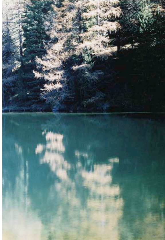
Karin Mack: ohne Titel- und Jahresangabe (aus: Karin Mack, Räume des Selbst , Ausstellungskatalog FLUSS –NÖ Initiative für Foto- und Medienkunst, Wolkersdorf, Salzburg: Fotohof Edition, 2010, S. 44)

Es handelt sich um Bild-im-Bild-Entwürfe, die Mack bevorzugt, was erst recht den Rezensenten veranlassen könnte, mit Bildern zu argumentieren. Damit würde eine Facette der künstlerischen Arbeitsweise in die Auseinandersetzung mit dem Œuvre einfließen. Mit der Konfrontation der diversen Spielarten, die die Fotokünstlerin aufgreift, tritt ihr Ansinnen zutage, dem Wesen des Selbst, der Natur und des Mediums bildlich nachzugehen. Dabei richtet sie die Kamera gegen einen Spiegel, werden Abzüge miteinander kombiniert, Schattenwürfe aufgezeichnet, die Augen gegen den Himmel und auf das Wasser gerichtet, wird manchmal die unendliche Weite und ein anderes Mal das Ephemere gesucht. Es geht immer auch um Konstitutive, die der Fotografie eingeschrieben sind: das gleichzeitige Zeigen und Verbergen, das Beleuchten und Verdunkeln, das Nachweisen und Täuschen. Bild im Bild bedeutet, das eine aufzunehmen und das andere im selben Moment auszuschließen.