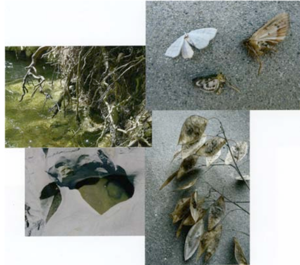
Karin Mack: „Koordinaten #7“, 2009 (aus: Karin Mack, Räume des Selbst , Ausstellungskatalog FLUSS –NÖ Initiative für Foto- und Medienkunst, Wolkersdorf, Salzburg: Fotohof Edition, 2010, S. 38)

Die Beobachtungen, die Mack anstellt, sind Dialoge mit sich selbst, zu denen die Bildobjekte das Material für eine Auseinandersetzung liefern, die erst in den Serien und Zusammenstellungen ihren erweiterten Ausdruck findet. Die Einzelansichten stehen für die Worte – Ausrufe, Namen, Titel –, die zu Sätzen gereiht und geformt werden. Was gesagt werden soll, verbirgt sich zwischen den Bildern und erschließt sich erst in der aufmerksamen Betrachtung. So entsteht oft der Eindruck – insbesondere wenn Selbstporträts verwendet werden –, dass die Künstlerin Fragen stellt und sich zugleich von den Realien abwendet und im Träumerischen Zuflucht sucht: im Traum von sich selbst.