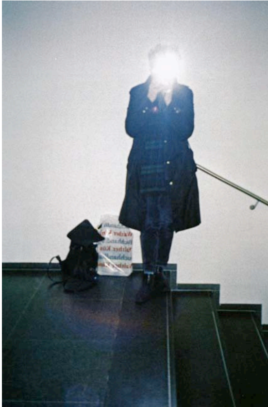
Karin Mack: ohne Titel, aus der „Serie Schatten- und Spiegelporträts“, 1977 – 2010 (aus: Karin Mack, Räume des Selbst , Ausstellungskatalog FLUSS –NÖ Initiative für Foto- und Medienkunst, Wolkersdorf, Salzburg: Fotohof Edition, 2010, S. 35)