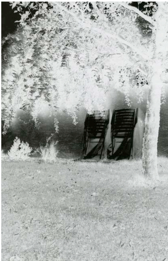
Karin Mack: ohne Titel, aus der Serie „Weisse Schatten auf schwarzem Schnee“, 1982, Negativprint (aus: Karin Mack, Räume des Selbst , Ausstellungskatalog FLUSS – NÖ Initiative für Foto- und Medienkunst, Wolkersdorf, Salzburg: Fotohof Edition, 2010, S. 8)

Die beiden Gedichte lassen sowohl die Spannweite visueller Poesie erkennen, wie sie die Strukturen von Sprachbildern anschaulich machen. Sie führen zu einer wesentlich anderen Lektüre, als würde lediglich eines für sich stehen.