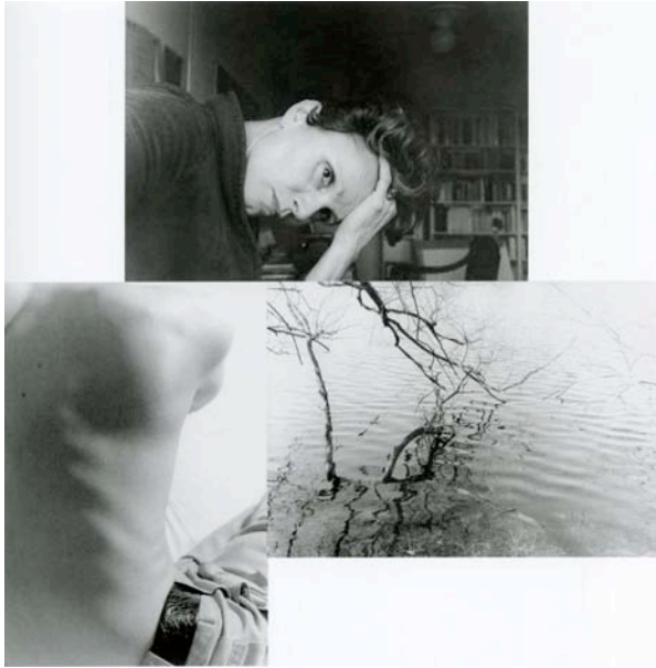
Karin Mack: „Wellen“, 1985 (aus: Karin Mack, Räume des Selbst , Ausstellungskatalog FLUSS –NÖ Initiative für Foto- und Medienkunst, Wolkersdorf, Salzburg: Fotohof Edition, 2010, S. 13)